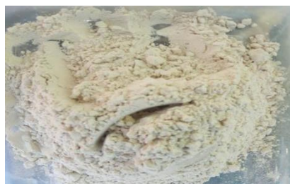
Gambar 2. Pati talas dari umbi talas

Pati talas dari tepung talas dilakukan beberapa tahapan yaitu mulai dari proses pamarutan, penjemuran dibawah sinar matahari, perendaman menggunakan air biasa selama 24 jam dan pengendapan. Pada proses pengendapan dan pengeringan tepung umbi talas, dihasilkan padatan serbuk seperti yang ditunjukkan pada Gambar 2. Proses pengendapan dan pengeringan tepung talas dari umbinya menghasilkan pati yang berwarna putih. Karakteristik hasil tepung umbi talas yang dihasilkan pada penelitian ini sama dengan karakteristik pati talas yang dihasilkan pada penelitian Rusmanto et al., (2017). Pati talas digunakan sebagai pelapis pada cabai merah untuk memperpanjang masa simpan.