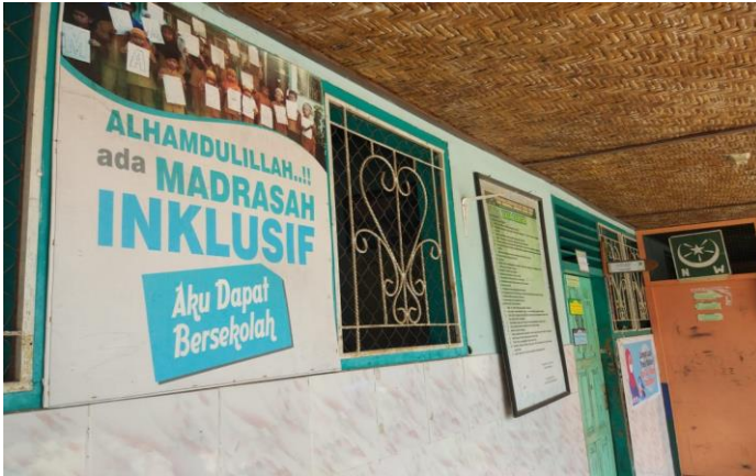
Gambar 5.1 Ekspresi Rasa Syukur dengan Madrasah Inklusif

Demikian juga slogan yang mencerminkan bentuk penerimaan terhadap anak-anak yang berkebutuhan khusus tertulis dengan sangat mudah untuk dibaca, sehingga memberikan kegembiraan bagi yang membacanya, serta menggugah agar pembaca aware terhadap bentuk diskriminasi.