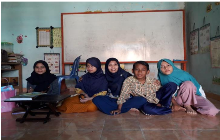
Gambar 5.4 Bentuk Dampingan Teman Sebaya

Dan seringkali guru juga mengajak anak-anak reguler untuk bersama-sama mengunjungi rumah anak berkebutuhan khusus untuk memberikan support agar semangat belajar mereka tetap semangat dan bahagia. Hal ini mengingatkan tulisan Sapon-Shevin 77 , bahwa pendidikan inklusif berarti menciptakan dan menjaga komunitas kelas yang hangat, menerima keanekaragaman, dan menghargai perbedaan. Guru mempunyai tanggung jawab menciptakan suasana kelas yang menampung semua anak secara penuh dengan menekankan suasana dan perilaku sosial yang menghargai perbedaan, mencakup perbedaan kemampuan, kondisi fisik, sosial ekonomi, suku, agama, dan sebagainya. Lebih jauh lagi bahwa, pendidikan inklusif berarti penerapan kurikulum yang multilevel dan multimodalitas, bisa dilaksanakan dengan modifikasi kurikulum dengan menggunakan sumber daya yang tersedia.