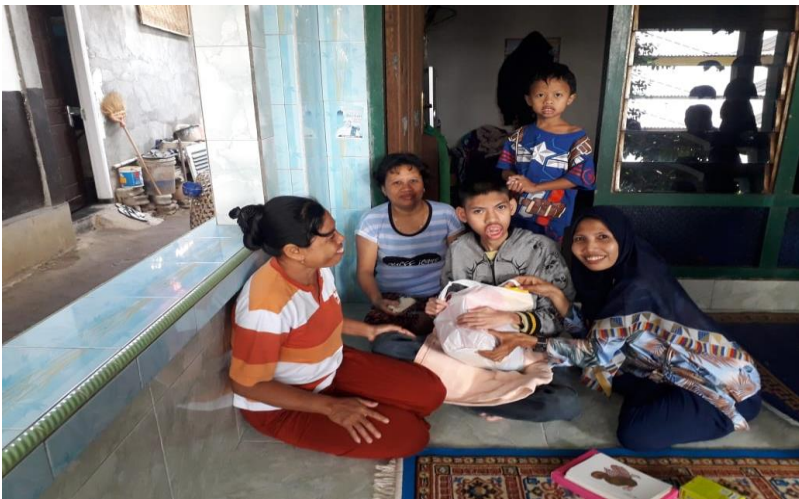
Gambar 5.3 Bentuk Layanan Guru Kepada ABK

Selama masa pandemi covid 19 terhitung dari pertengahan bulan Maret, pembelajaran di MI NW Tanak Beak Narmada untuk kelas reguler dilakukan di masing-masing guru kelasnya, sementara pembelajaran atau pendampingan untk anak berkebutuhan khusu, guru mendatangi rumah siswa langsung.