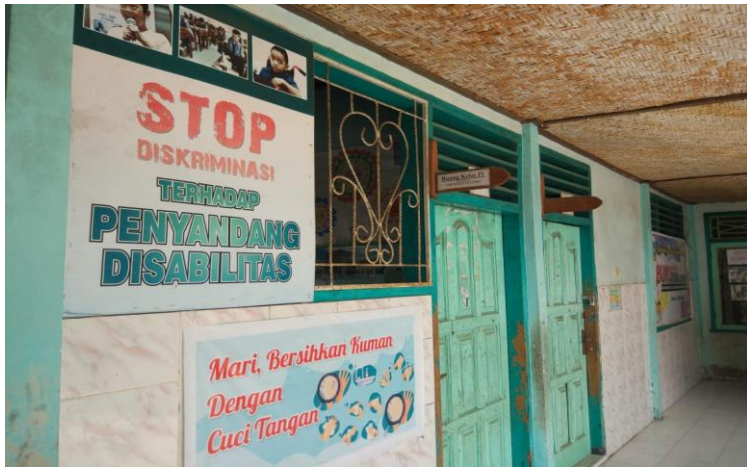
Gambar 5.2 Foto Sambutan Hangat bagi ABK

Merupakan payung hukum penyelenggaraan program pendidikan Inklusif yang disebut dan didukung penuh oleh Madrasah Ibtidaiyyah NW Tanak Beak. Dalam kapasitasnya sebagai lembaga penyelenggaraan program pendidikan Inklusif, Madrasah Ibtidaiyyah NW Tanak Beak Narmada mendidik sekitar 33 siswa berkebutuhan khusus yang berasal dari berbagai wilayah di Kabupaten Lombok Barat, selain dari pada dukungan terhadap program wajib belajar 9 tahun, kepala MI NW Tanak Beak Narmada menegaskan komitmennya dalam dunia pendidikan melalui penyelenggaraan program pendidikan Inklusif sebagai bentuk keperhatian terhadap kebutuhan anak-anak ABK akan