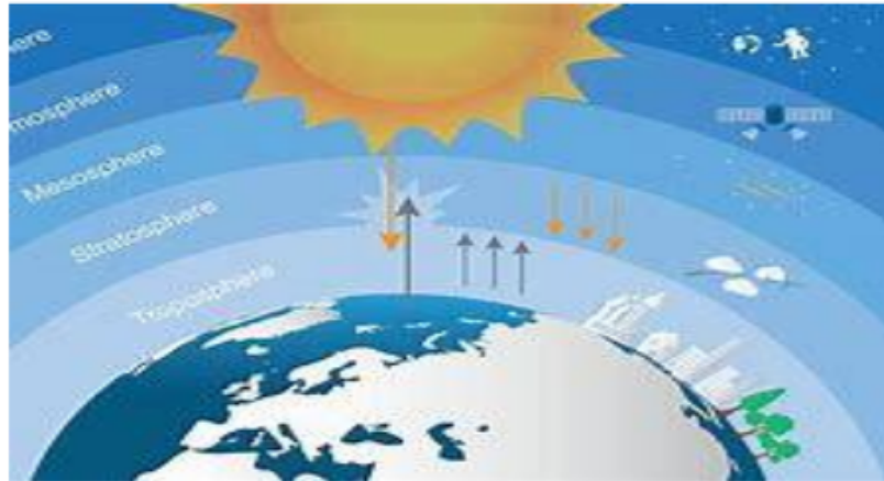
Gambar 1.7 Atmosfer

Atmosfer atau ruang angkasa sangat menarik untuk dijelajahi. Kebetulan, ruang angkasa penuh dengan benda-benda langit (miliaran) tak berujung dan memiliki berbagai bentuk.