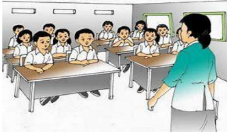
Gambar 1.2 contoh interaksi social di Sekolah

Manusia diciptakan sebagai makhluk terindah di muka bumi. Manusia juga memiliki keterbatasan. Dengan keterbatasan tersebut, manusia tidak dapat dipisahkan dari orang lain dalam kehidupan sehari-hari. Sehingga terjadinya sikap saling menghargai antar manusia baik secara individu maupun kelompok.