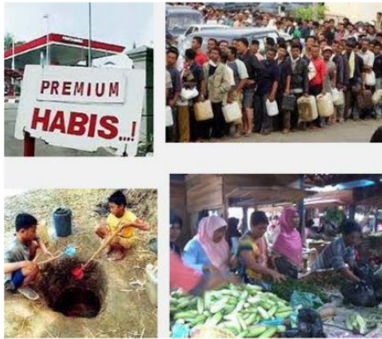
Gambar 1.3 kelangkaan sumber daya alam

lain, jika jumlah barang dagangan lebih dari yang dibutuhkan, biaya produk akan turun. Oleh karena itu, diperlukan pengendalian dan stabilitas pasokan barang bagi konsumen.