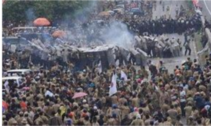
Gambar 2.1 Konflik sosial

menghancurkan kelompok lain meskipun menyimpang dari tujuan tersebut.