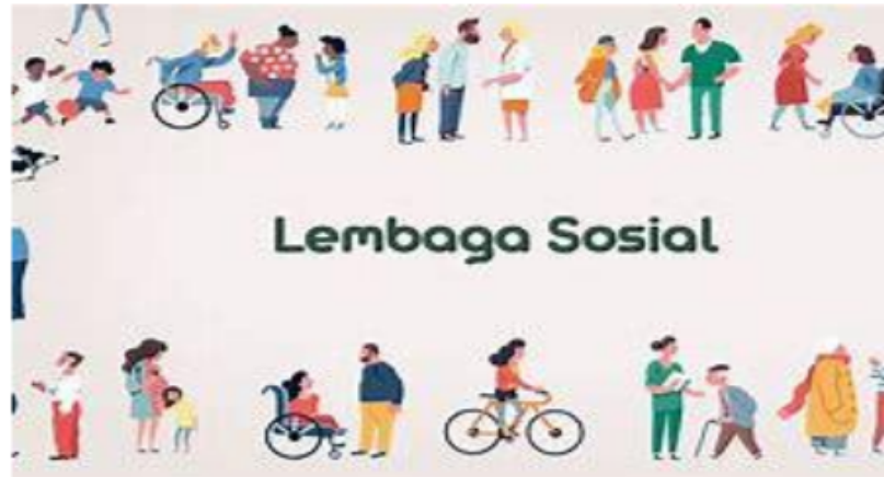
Gambar 2.5 Lembaga Sosial

1 setiap orang harus berperilaku sesuai aturan tersebut agar proses pendidikan berjalan dengan baik. Demikian juga suatu perusahaan memiliki aturan-aturan tertentu antara karyawan dengan atasan sehingga harus berperilaku sesuai dengan aturan yang berlaku.