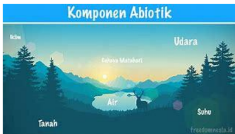
Gambar 1.4 Komponen abiotic