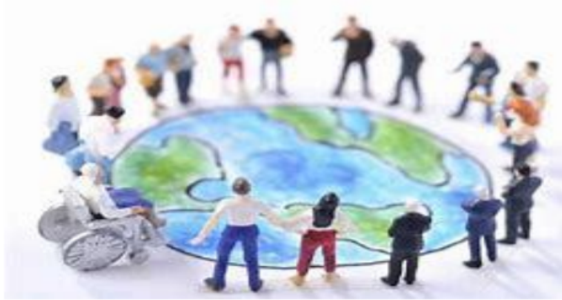
Gambar 1.9 Sosiologi