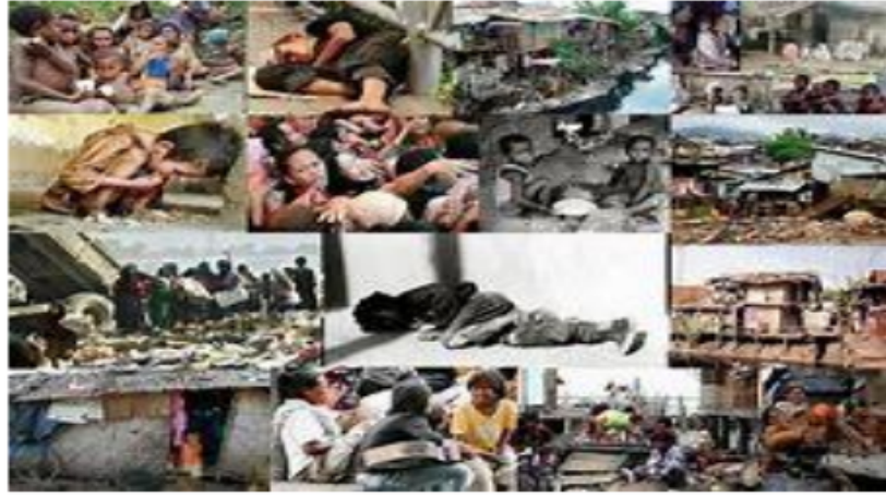
Gambar 2.3 Masalah Sosial

Dalam pendekatannya, masalah sosial ini dapat terbagi menjadi dua kelompok, yaitu pendekatan realis dan objektif dan konstruksionisme sosial. Sedangkan untuk pendekatan realis dan objektif, fokusnya lebih pada kondisi dan kekuatan yang mendasari yang menjadi penyebab masalah, seringkali dalam pandangannya ia mengutamakan tindakan amelioratif, artinya peningkatan nilai maknanya dari makna biasa atau buruk. akan menjadi lebih baik. sementara pendekatan konstruksionisme sosial ini memfokuskan pandangannya pada kondisi objektif tetapi mengarah pada definisi proses sosial dan kondisi ini akan muncul sebagai masalah.