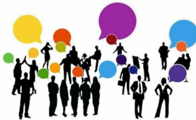
Gambar 1.1 Interaksi sosial

Ilmu sosial adalah ilmu yang mengkaji tentang hakikat manusia sebagai makhluk sosial. Manusia sebagai makhluk sosial yang selalu membutuhkan interaksi dengan manusia lainnya. Dengan demikian ilmu sosial merupakan suatu disiplin ilmu yang mencakup seluruh aspek kehidupan manusia mulai dari interaksi antara individu dengan manusia. Gambar 1.1 menunjukkan contoh interaksi social.