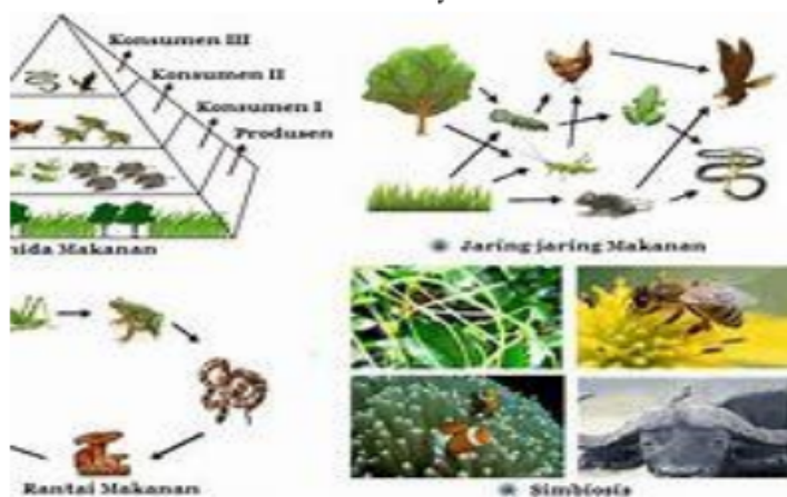
Gambar 1.5 Kompnen Biotik