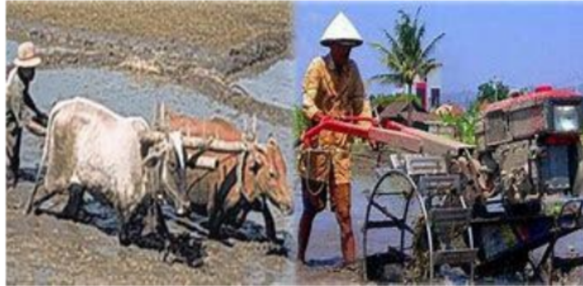
Gambar 2.2 Perubahan sosial

5 Seperti yang diketahui bahwa tidak ada yang abadi di dunia ini kecuali perubahan itu sendiri. Artinya perubahan ini akan tetap dan terus terjadi sebagaimana mestinya karena perubahan tersebut tidak hanya penting bagi kehidupan individu, kelompok maupun masyarakat, tetapi perubahan merupakan suatu kehidupan di dalam kehidupan. Sehingga masyarakat akan terus berproses dengan tujuannya. Dalam bentuknya, perubahan sosial ini dapat terjadi melalui berbagai bentuk perubahan dari evolusi sosial universal.