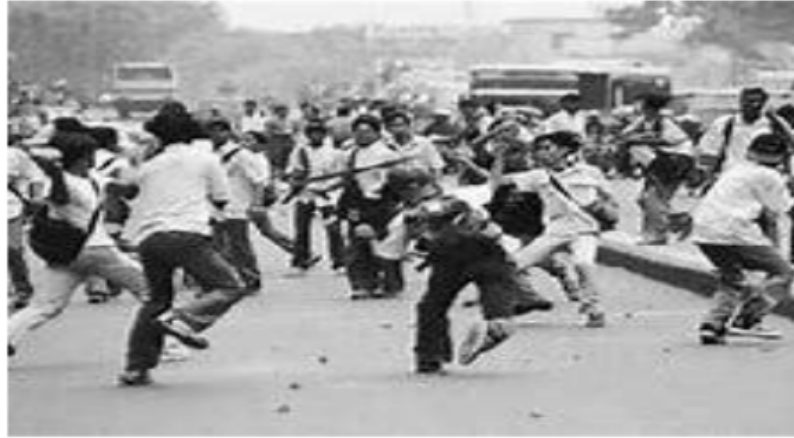
Gambar 2.4 Penyimpangan Sosial

Akan tetapi, istilah penyimpangan tidak selalu berarti negatif, di sisi lain memiliki arti positif, yang berarti penyimpangan yang berdampak positif pada suatu sistem sosial karena mengandung unsur-unsur yang kreatif, inovatif dan memperkaya wawasan seseorang, seperti emansipasi wanita dalam kehidupan publik yang dapat mengarah pada wanita berkarir.