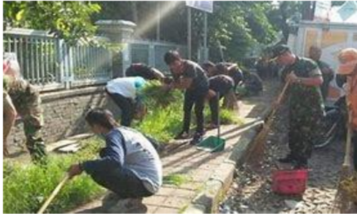
Gambar 1.6 Lingkungan Sosial

manusia berupa berwujud tindakan atau aktivitas manusia baik dalam hubungannya dengan lingkungan alam maupun hubungan antarmanusia.