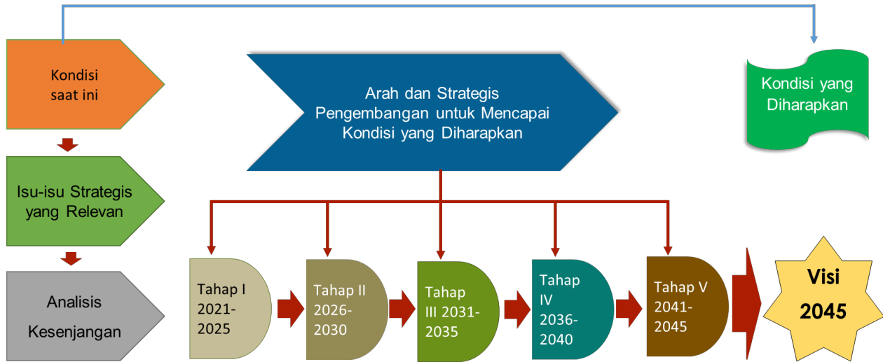
Gambar 2.1. Tahapan Mencapai Visi 2045