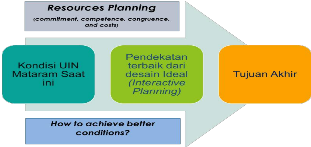
Gambar 2.3. Desain Road Map UIN Mataram