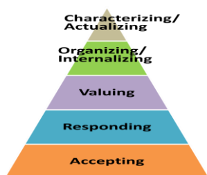
Smartart 1. Taxonomi Sikap Krathwohl

Dari smartart di atas dapat dirumuskan tiga prinsip penanaman nilai, yaitu; Pertama , internalisasi nilai harus dilakukan secara bertahap dan berjenjang, yaitu mulai dari bagian ranah yang paling bawah dan sederhana, kemudian dilanjutkan secara urut ke jenjang-jenjang yang lebih tinggi. Penanaman nilai tidak bisa dari atas ke bawah, atau dilakukan zig-zag. Kedua , internalisasi nilai harus dilakukan secara sistematis, artinya penanaman nilai melibatkan beberapa komponen, yaitu; pebelajar, sumber datangnya nilai, dan harus memiliki cara tepat dan efektif. Ketiga , keberhasilan internalisasi nilai ditentukan oleh pebelajar itu sendiri, bukan oleh sumber belajar/sumber datangnya nilai. Hal ini dikarenakan pebelajar itulah yang melakukan proses internalisasi tersebut, sedangkan sumber belajar/sumber nilai hanya sebagai referensi yang memberikan cahaya penerang jalan. Pebelajar lah yang menentukan kemana akan melangkah, sampai dimana nilai akan diinternalisasi.