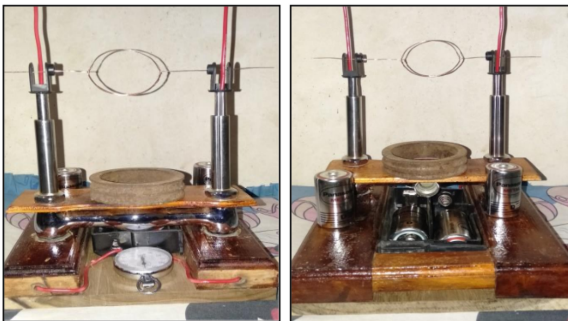
Gambar 2. Hasil Pengembangan Alat Peraga

Alat peraga yang dikembangkan memiliki spesifikasi produk yang mengacu pada hasil analisis kebutuhan pada sekolah yang menjadi lokasi penelitian. Berikut adalah alat peraga gaya elektromagnetik yang telah dikembangkan.