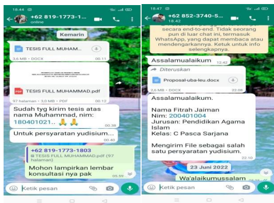
Gambar.3 Contoh pengiriman file jam 00.40 wita