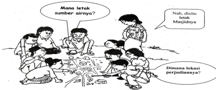
Gambar 1.2 Pemetaan Desa Bayan Kabupaten Lombok Utara