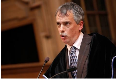
Gambar 4. 1 Profesor Will Kymlicka