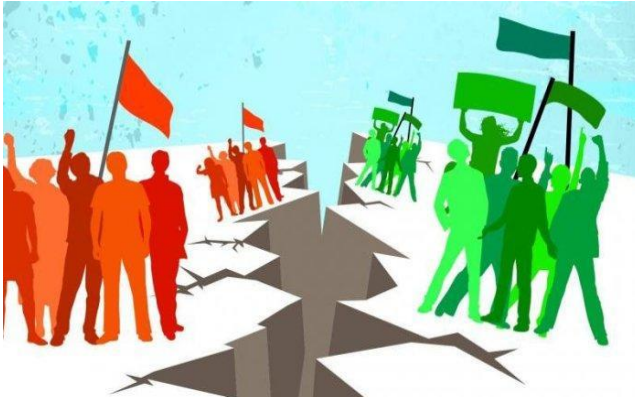
Gambar 3. 1 Orang Sedang Berkonflik