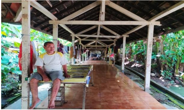
Gambar 1. 5 Wisma Transito Jema'ah Ahmadiyah di Praya Lombok Tengah, Eks Rumah Sakit Praya