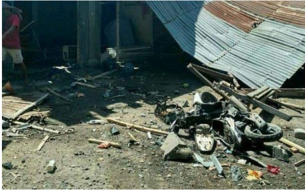
Gambar 1. 4 Tragedi Pengerusakan Barang-Barang Warga Ahmadiyah di Lombok Timur