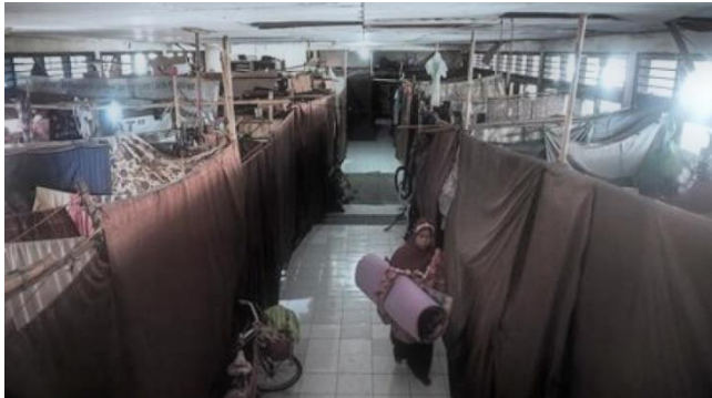
Gambar 3. 3 Kondisi Pengungsian Wisma Transito Mataram,NTB

Asrama Transito dan eks Rumah Sakit Umum Praya. Seperti halnya pada bab sebelumnya, bab ini juga diawali dengan pemaparan tentang permasalahan yang ada berdasarkan pada hasil wawancara dengan berbagai pihak, serta hasil pengamatan peneliti selama berkunjung ke tempat pengungsian. Wawancara antara lain ditujukan kepada Jauzi Jafar selaku DPW JAI NTB; Nasirudin Ahmadi, mubaligh JAI wilayah Mataram; Nursalim, ketu JAI cabang Lombok Tengah; serta beberapa pengungsi internal JAI di Asrama Transito maupun eks Rumah Sakit Praya.