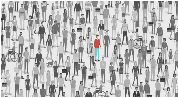
Gambar 4. 2 Gambaran minoritas di tengah mayoritas