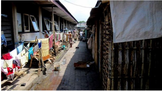
Gambar 1. 6 Wisma Transito Jema'ah Ahmadiyah di Mataram, Eks Asrama Haji