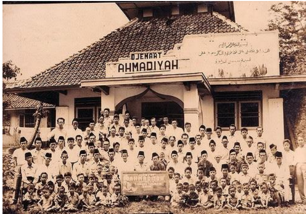
Gambar 1. 1 Ahmadiyah Pada Masa Kemerdekaan

ada. Adanya perbedaan pada ketika itu dikesampingkan dan hanya fokus pada tema “merdeka atau mati”, pada akhirnya di tanggal 17 agustus 1945 Indonesia resmi menjadi negara yang merdeka melalui pidato proklamasi kemerdekaan.