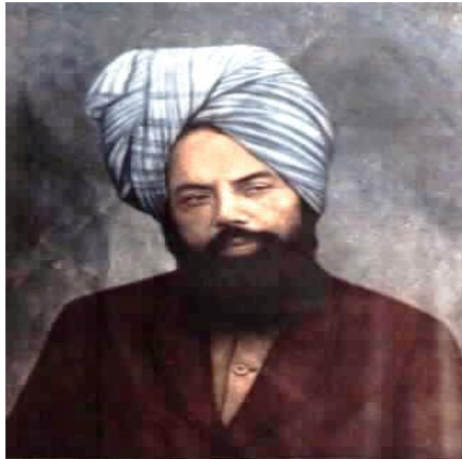
Gambar 1. 2 Mirza Ghulam Ahmad

(Hanafi, 2011:1). Mirza Ghulam Ahmad adalah keturunan bangsawan Moghul yang berprofesi sebagai hakim di Lahore (Ahmad, 2007:185). Pada tahun 1914, ternyata Ahmadiyah terpecah menjadi 2 golongan, golongan pertama berpusat di Qadian, yang dipimpin oleh Mirza Basyiruddin Mahmud Ahmad, putra dari almarhum Mirza Ghulam Ahmad, Sekarang berpusat di Rabwah Pakistan. Golongan lainnya berpusat di Lahore, Pakistan di bawah pimpinan Maulan Muhammad Ali M.A.L.L.B, yaitu sekretaris Ahmadiyah Hazrat Mirza Ghulam Ahmad (Hanafi, 2011:2).