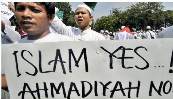
Gambar 1. 7 Sikap Penolakan Masyarakat terhadap Jema'ah Ahmadiyah

Semenjak masuk dan berkembangnya paham Ahmadiyah di Lombok, selama kurang lebih 27 tahun dari awal mula kedatangannya (1971-1998), warga Ahmadiyah Lombok (baca: JAI) hidup dalam kondisi yang aman dan kondusif. Menurut pengakuan Nashiruddin Ahmadi, warga JAI Lombok dalam kehidupan sosial kemasyarakatannya saling menghormati dengan warga setempat. Warga setempat dan juga warga JAI saling bekerjasama dalam bergotong royong, membangun masjid, bahkan memperbaiki jalan di wilayah setempat. Hal ini memperlihatkan bahwa warga setempat sebenarnya menerima warga JAI dengan ramah, kekeluargaan dan penuh toleransi.