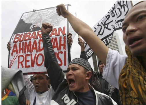
Gambar 3. 2 Aksi Demo Terhadap Keberadaan Ahmadiyah