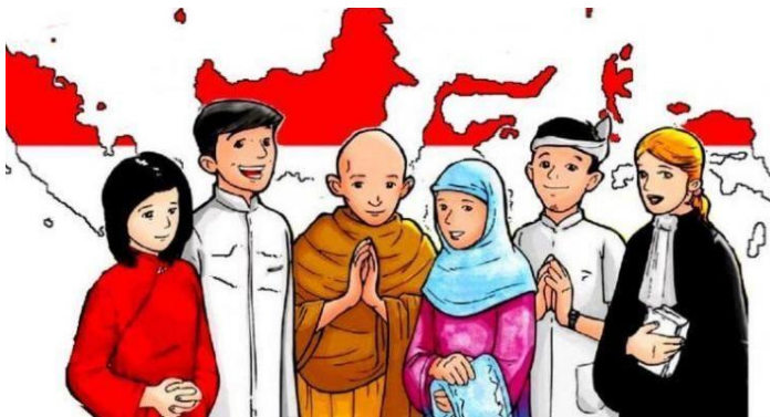
Gambar 2. 1 Identitas warganegara di Indonesia

Persoalan kewarganegaraan menjadi persoalan pelik yang dihadapi oleh setiap bangsa di Dunia, tak terkecuali Indonesia. Indonesia dengan keberagaman sosial kultural dan agama juga menghadapi persoalan dalam merumuskan dan menentukan status kewarganegaraan dan legalitasnya. Selain itu, persoalan kewarganegaraan juga terimplikasi di dalam pengikutsertaan entitas agama dalam identitas kewarganegaraan di negeri ini. Kewarganegaraan digunakan sebagai alat kontrol dan agama yang termaktub di dalamnya dijadikan sebagai pengidentifikasi. Ia menegaskan keberadaan seseorang sebagai warga negara.