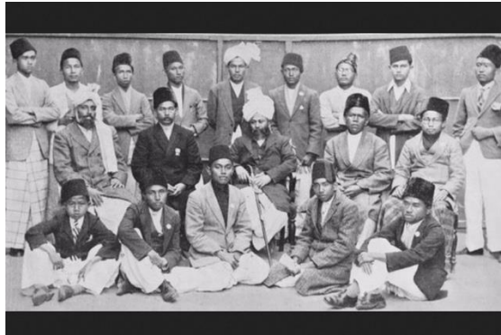
Gambar 1. 3 Pemimpin Ahmadi dan para santri Baru Tahun 1930-an